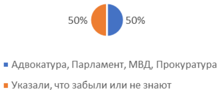
Рис 2. Вопрос: «Перечислите все известные Вам органы государственной власти (должностные лица), в которые можно обратиться за защитой прав детей» (открытый вопрос, без заданных вариантов ответа)?

Однако, некоторые дети не могли дать определенного ответа, имели сложности в формировании своих мыслей. Одной из причин, на наш взгляд может быть недостаточная осведомленность и информированность о правах ребенка в цифровой среде прежде всего самих детей.